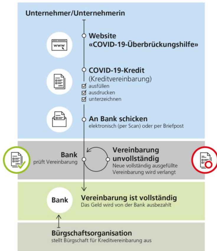
Abbildung 2: Vorgehen Bürgschaftskredit bis CHF 500'000

(10% Jahresumsatz, bis max. CHF 500'000)