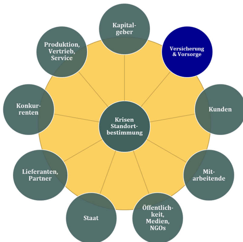
Abbildung 1: Krisen Standortbestimmung