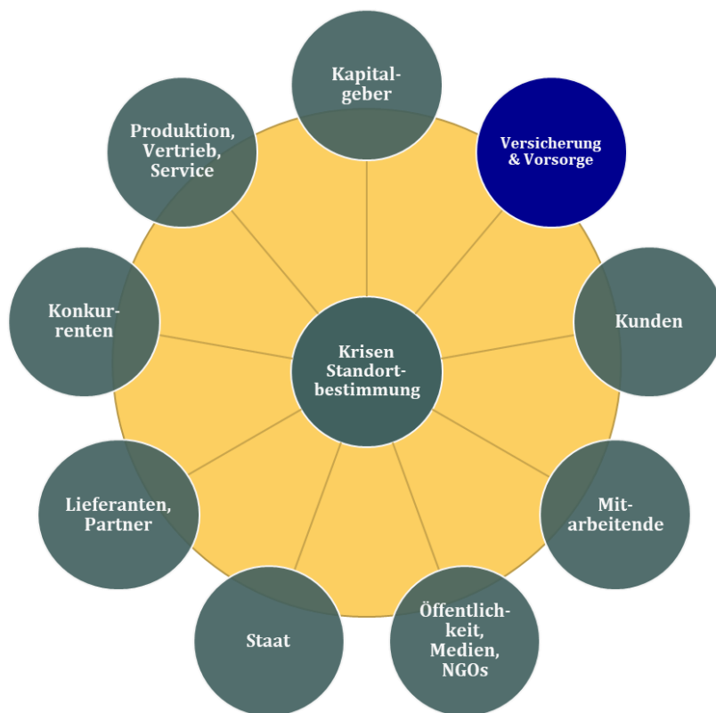
Abbildung 1: Krisen Standortbestimmung