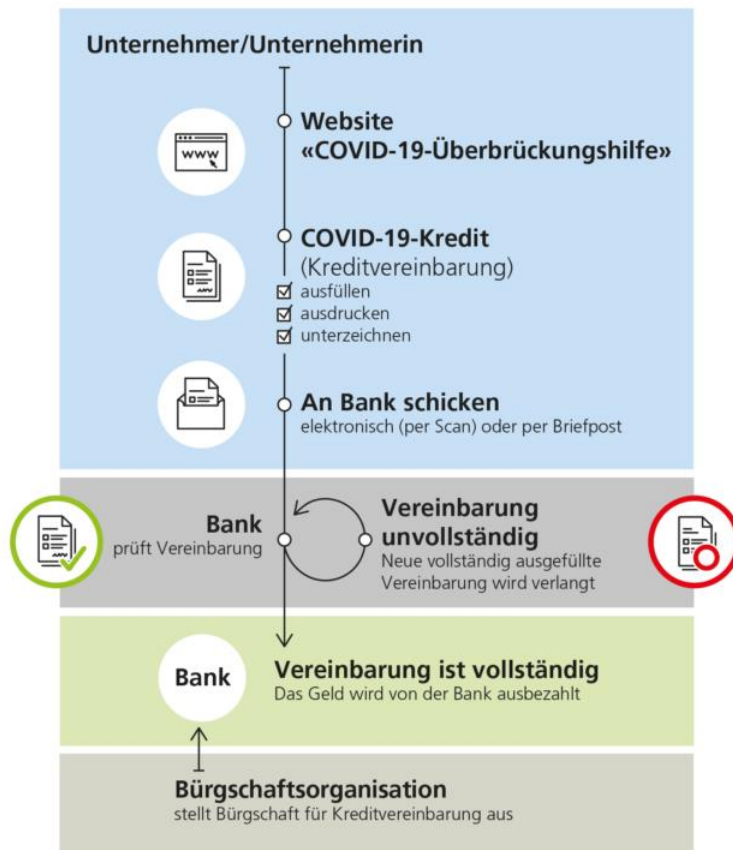
Abbildung 2: Vorgehen Bürgschaftskredit bis CHF 500'000

(10% Jahresumsatz, bis max. CHF 500'000)