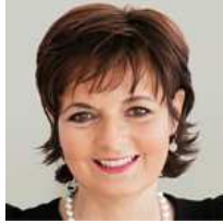
Ruth Metzler Membre depuis 2012 Vice-présidente depuis 2019