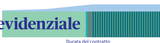
Durata del contratto