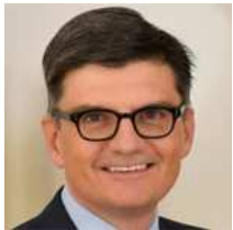
Michele Bernasconi Distribuzione